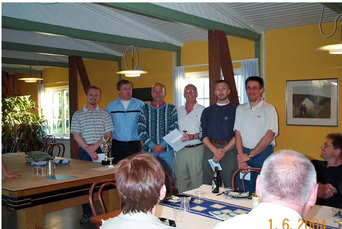
På billedet ses ”vinderne” af Anders Open

Alt hvad du skal gøre er at besøge vor hjemmeside www.sif-idraet.dk/badminton , så kan du forsøge dig ud i kogekunsten!