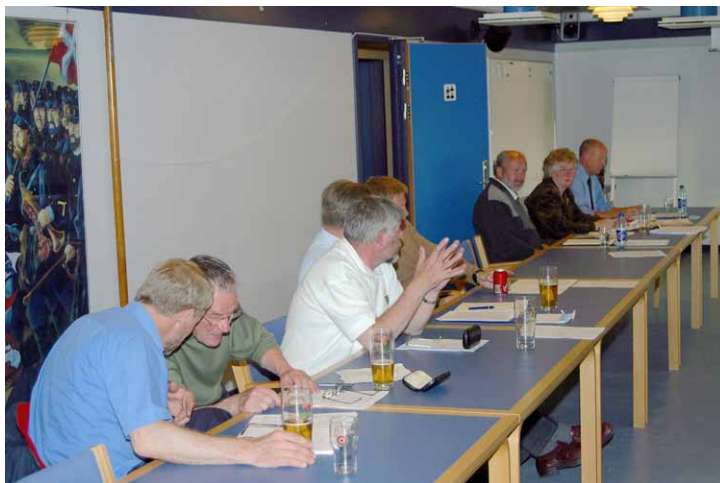
Foto fra SIF Landsmøde