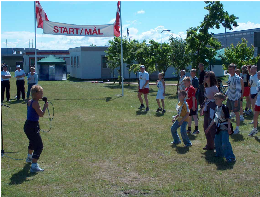
Foto fra SIF FRH AKTIVITETSDAG

Det var 3. gang aktivitetssdagen blev afholdt og vi forsøger til stadighed at gøre det bedre og bedre fra gang til gang. På opfordring blev aktivitetssdagen lagt på en lørdag, hvilket ud fra det store deltagerantal at dømme, var et rigtigt valg. Derudover deltog Sergentmessen på flådestationen i arrangementet, ved at stille lokaler til rådighed samt et jazz orkester. En succes, som vi håber, kan gentages næste gang i 2006. Som afslutning på dagen overrakte chefen for Flådestation Frederikshavn et utal af præmier afpasset efter modtagerne og disciplinen, der var vundet. Igen i år var polo-shirten med SIFFRH logo broderet på en kærkommen præmie. Efter præmieoverrækkelsen blev der serveret grill mand til godt 150 personer, humøret var højt, og der blev hyggesnakket til langt ud på aftenen.