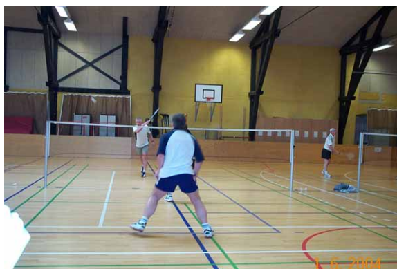
Billeder fra de hårde kampe

Resultatet af aftenens anstrengelser blev følgende: